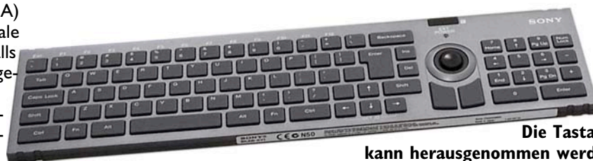
Die Tastatur kann herausgenommen werden, bleibt aber dank Akku und Infrarot-Verbindung dennoch funktionsfähig.